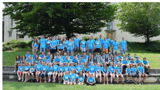
Sportanlagen in Le Landeron