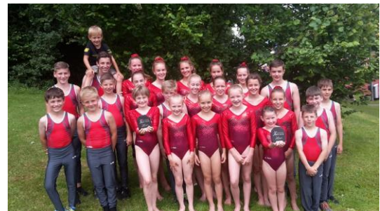
Die TurnerInnen sind stolz auf ihre beiden Titel

Die Rangliste findet ihr hier . Weitere Bilder sind auf der Facebook-Seite unserer Jugend zu finden.