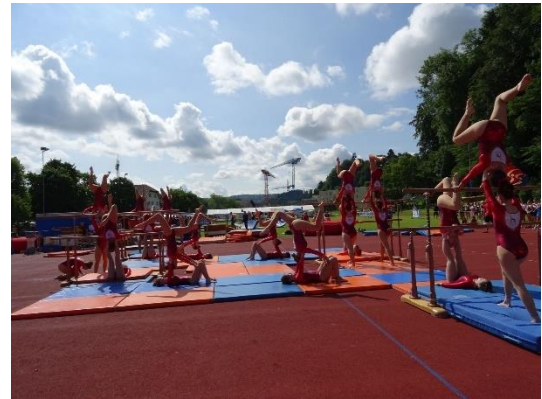
Trotz Musikausfall nicht zu stoppen – die Damenriege mit der Gerätekombination