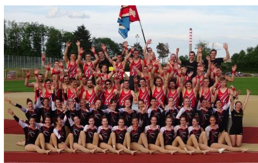
Die DR und der TV am Fricktalercup in Stein

Wir durften dieses Jahr bereits zahlreiche Vorführungen zeigen. Alle Auftritte haben eine Gemeinsamkeit: Wir wurden stets von vielen Fans und Schlachtenbummlern unterstützt. Diese sorgten jeweils für eine fantastische Stimmung. Es ist für uns immer ein tolles Gefühl, so eine grosse Unterstützung im Rücken zu spüren. Unser Dank gilt allen, welche Wettkampf für Wettkampf mitreisen, um uns anzufeuern.