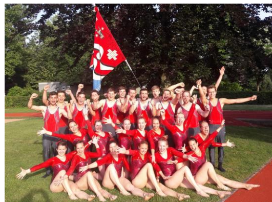
Reck-Team 2018 – Am ersten gemeinsamen Wettkampf bereits der erste Sieg

Die Bilder sind in der Galerie , ein Zeitungsbericht wurde veröffentlicht und die Rangliste findet ihr hier .