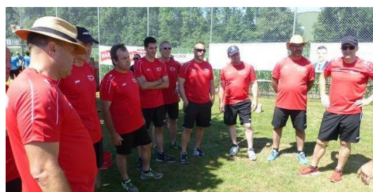
Bekannt für seine starken Steinheber – die Männerriege Sulz