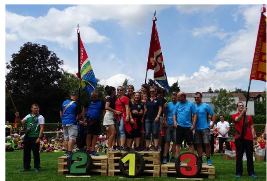
Sieg der Frauenriege am 3-Kreisturnfest