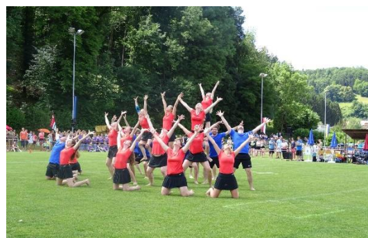
Die Sulzer GymnastikturnerInnen an der AMV

Die Neuerung tritt im Jahr 2020 in Kraft. Da im Jahr 2019 aufgrund des Eidgenössischen Turnfestes keine SMV durchgeführt wird, wird dieses Jahr zum letzten Mal ein Schweizermeister in der Disziplin «Gymnastik Grossfeld» gekürt.