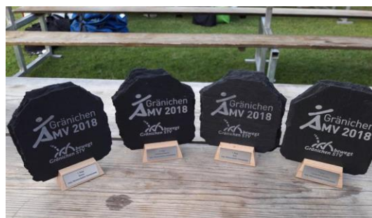
Unsere Ausbeute der AMV – Können wir an der SMV unser Palmares erweitern?

Treffpunkt wird bei einer Qualifikation kommuniziert 09.00 Start Final 17.00 Siegerehrung