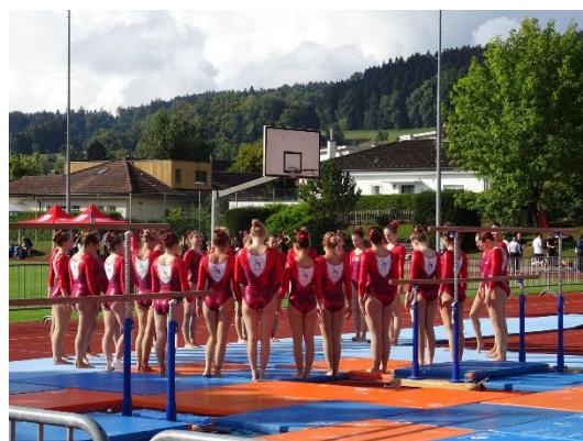
Die Damenriege bei den Vorbereitungen vor der Gerätekombination