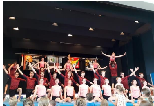
Showgruppe an der Fahnenweihe in Wil

Am 08. Juni wurde das Programm in Tamm bei Stuttgart vorgeführt. Das Publikum tobte und honorierte die Vorführung mit einem «Standing Ovation».