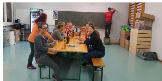
Das neue Vereinslokal

Tatkräftige Mitglieder der Frauen- und Männerriege haben im bisherigen Krafraum ein neues Vereinslokal eingerichtet. Der Krafraum befindet sich nun im bisherigen Vereinslokal im Untergeschoss.